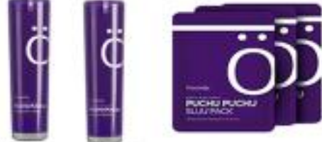
푸슈푸슈 에센스 스킨 푸슈푸슈 수쿠 크림 푸슈푸슈 수쿠 팩