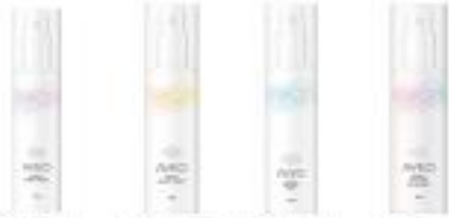
AVEO 에너지 톤링 크림 AVEO 에너지 톤링 세럼 AVEO 에너지 미스트 AVEO 에너지 크림